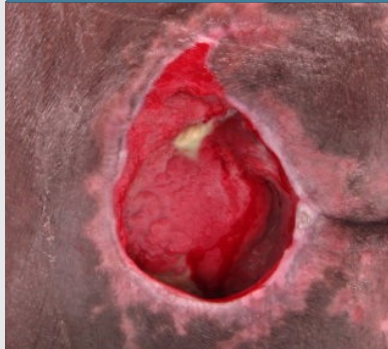
Prima dell'applicazione di OASIS