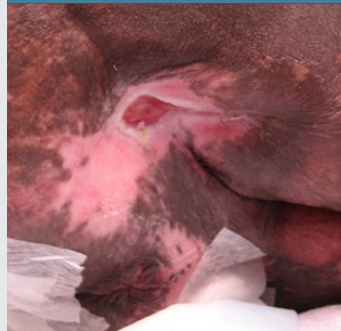
Ulcera ischiatica destra 1 settimana dopo l'applicazione iniziale di OASIS