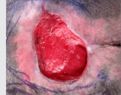
9 settimane dopo l'applicazione iniziale di OASIS, prima della procedura con lembo

Nota: i risultati individuali possono variare.