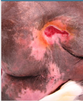
Ulcera ischiatica destra prima dell'applicazione di OASIS