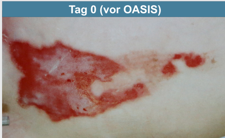
5 Tage nach der Verbrennung, vor OASIS-Anwendung